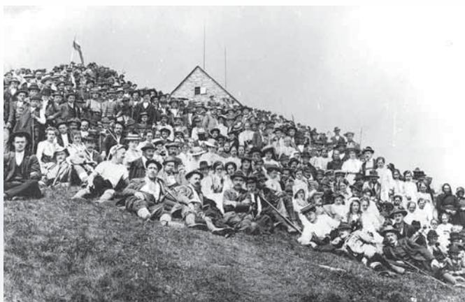
Odprtje planinske kočice na Poreznu 11. avgusta 1907