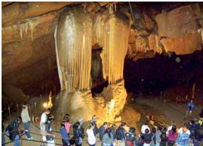
Obiskovalci pred Prestolom kralja Matjaža

V bližini Grosuplja, približno na polovici poti ob cesti proti Turjaku, vabi Županova jama v razkošje podzemeljskega sveta, ki ga je skozi tisočletja ustvarjala kraška voda.