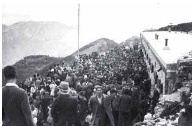
Odprtje Planinskega doma Porezen 14. avgusta 1949

Planinsko društvo Cerčno sodi med najstarejša planinska društva v Sloveniji. Ustanovljeno je bilo v letu 1904 kot podružnica SPD, le enajst let po ustanovitvi SPD v Ljubljani. Obsegalo je Cerkljansko s Poreznom in Blegošem ter Baško grapo s Črno prstjo in Rodico. Že takoj po ustanovitvi so označili poti na bližnje vrhove in postavili smerne table. Prva kočica je bila postavljena na vrhu Poreznu že v letu 1907.